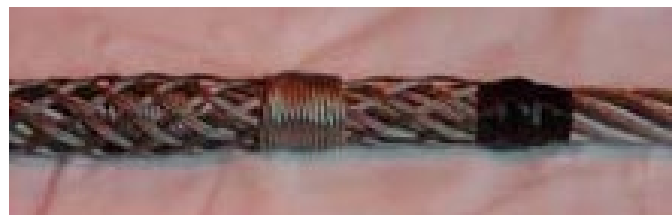
Tape enden så den ikke går op