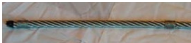
Wirebindsel påmonteret i enden og inde på wiren