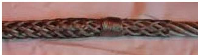
Montering af sikkerhedsbindsel udvendig